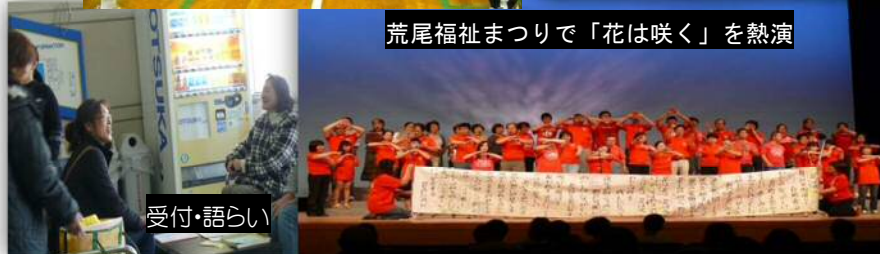
荒尾福祉まつりで「花は咲く」を熱演