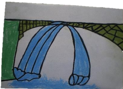
（アスリートの絵：【通潤橋】）