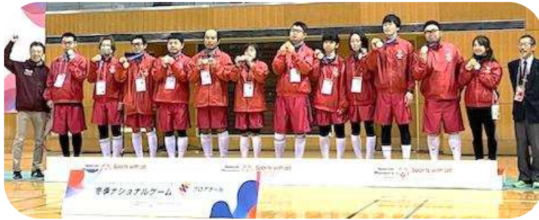
フロアボールチーム