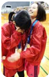
勝った瞬間、感極まって 大粒の涙が・・・アスリートと パートナー