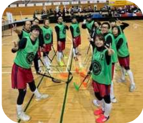
くまモンチーム！ 頑張るぞ!!

※らぼーる(rapport)とは、互いに信頼し、安心して気持ちを伝えあう“つながり”を意味するフランス語