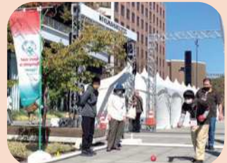
SOポッチャ体験コーナー