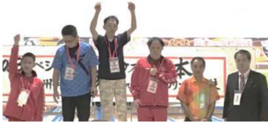
ボウリング競技 表彰式