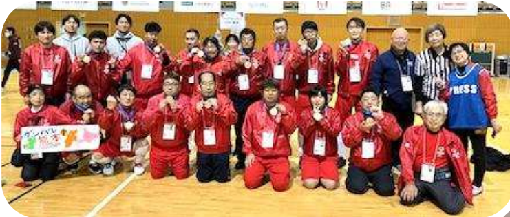
フロアホッケーチーム