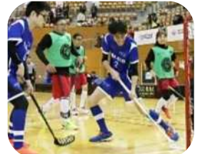
強豪・長野チーム との対戦