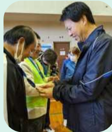
浅田市長とNG出場アスリート