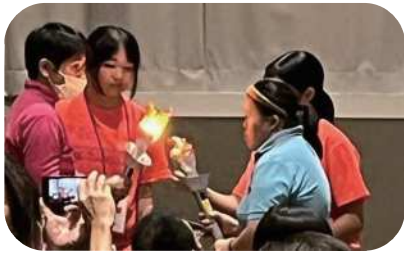
佐賀勤労者総合福祉センターで開会式が行われました。