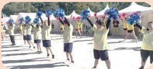
オープニング チアダンス

知的障がいを持った人たちの社会参加を支援するスペシャルオリンピックス日本(SON)・熊本は今年で30周年!ユニバーサルスポーツであるSOポッチャを障がいのある人もない人も、一緒に楽しみました。また、併せて障がい者就労施設の商品も販売。交流を通して相互理解を深め、誰もが笑顔で暮らす共生社会を目指しましょう!をテーマに一日過ごしました。