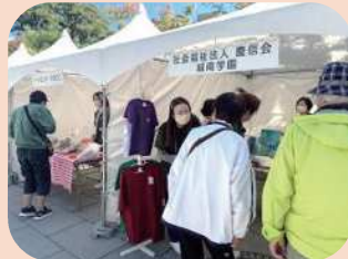
【障がい者就労施設の商品販売】