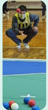
初めて体験する小学生や一般の参加者も楽しみました。