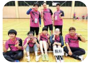
佐賀勤労者体育センターでは昨日の予選に引き続きバドミントン競技が行われました。