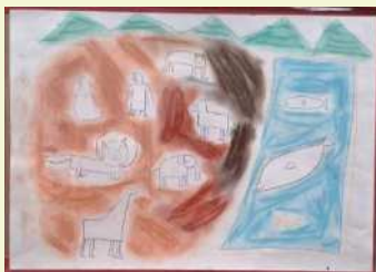
いろいろな動物や魚のカードを見ながら、色鉛筆を使って描きました。周りの背景はパステルを使い、指でぼかしています(熊本ブランチ:風間 一朗)