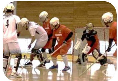
熱戦で勝利を獲得しました！