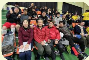
応援団も頑張りました!!職場の方も来てくれて、嬉しかったです。(アスリート)