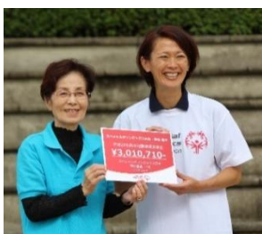
全国のSO地区組織より支援金をいただきました