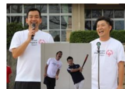
もっこすファイヤー