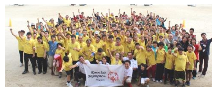
全国の皆さん、ありがとう!

先般の復興応援スポーツキャラバン2016には、SON・熊本の皆様、そして県内にお住まいの一般の皆様にも多数ご参加いただき大変嬉しく思いました。スポーツを通じて何か出来る事が無いかと願っておりましたが、共に身体を動かすことで一人の笑顔が周りの方々を笑顔にし、会場が笑顔でいっぱいになってゆく、そんなスポーツの力を改めて感じるイベントとなりました。震災から半年以上が過ぎながら、まだまだ困難が続いていると思います。熊本の日も早い復興を祈っております。