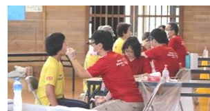
メディカルチェック(歯科検診)