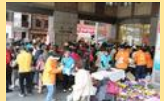
サタブラに出てPRしました!