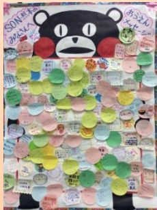
全国卓球大会の参加者からの応援メッセージ