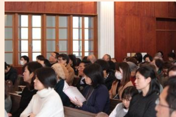
多くの人が応援に来てくれました