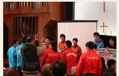
アスリートによるエール！ 「フー、フー」