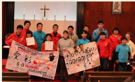
アスリートの皆さんから送られた横断旗と！