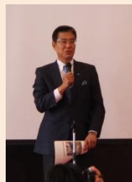
丸本実行委員長 挨拶