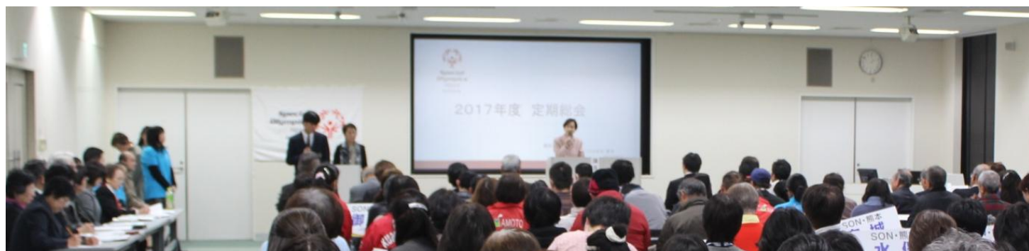
熊本日日新聞社本社 会議室にて