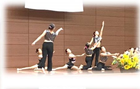
Cherry Blossomのパフォーマンス