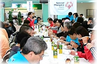
潮谷理事長の挨拶

陸上自衛隊第8師団によるカレーライス、黒髪校区の有志の方やボランティアの方が作ったフルーツポンチを食べながら、SON・熊本のアスリート・コーチ・ファミリー、SON・福岡の方々、益城中やご来賓の皆さんと交流会がありました。今年は、じゃんけん大会もあり、素敵な手作りバッグや巾着、ティッシュケースなどがプレゼントされました。