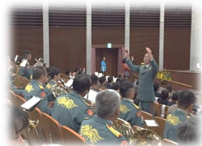
陸上自衛隊第8音楽隊の演奏