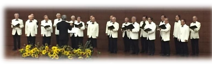
デメーテル男性合唱団の歌声