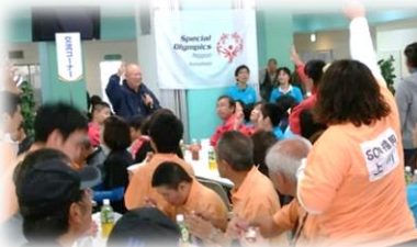
じゃんけん、勝ったよ!!