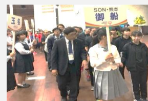
2019年地区大会 開会式

アスリートと一緒に活動するコーチボランティア、様々な イベントや行事のお手伝いをするイベントボランティア、 活動を裏方として支える委員会・事務局ボランティアなどがあります。 どうぞ自分のできるボランティアを探してください。