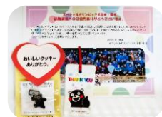
サンキューセット