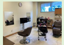
<ストレッチャーも入る美容室>

工夫をして見方を変えれば捨てられるものもキラキラとした作品になることを実際に見て学びました！