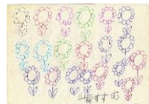
イラスト 山長 すずむ