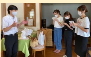
<お話を聞いている様子>

皆さん、ぜひアスリートの皆さんの笑顔を見に、パスタとパンを食べに行かれてみてください！！ (文責 インターンシップ生 清水)