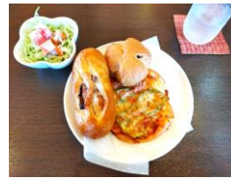
<お昼ご飯、美味しかったです>