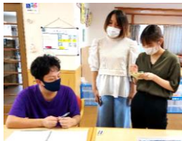
<真剣に話を聞いている様子>