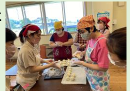
<栗饅頭を作っている様子>

「みなサポ」とは障がいのある人だけでなく、子どもからお年寄りまでをサポートするという意味が込められています。通所者の方々は、みなさんが伸び伸びと活動をされていて、明るい雰囲気であふれていました。私たちが訪問した時間には、健康ブースで風船バレーなどをたくさんの人で楽しまれました！また、みなさんで取ってこられた栗を使って栗饅頭を作られていて、とても美味しそうでした。