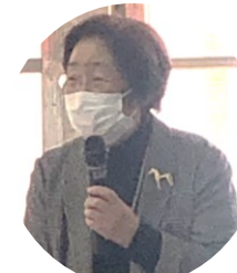
長年にわたって大変お世話になった、世良副理事長