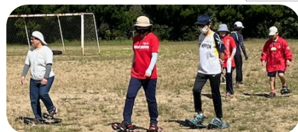
熊本では、芝の上で練習