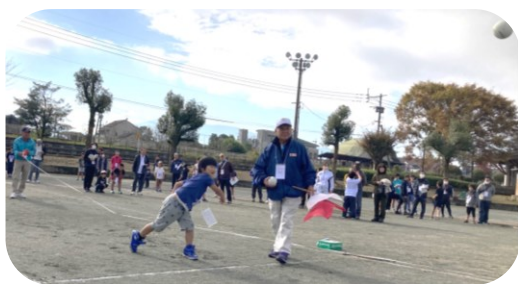
ソフトボール投げ