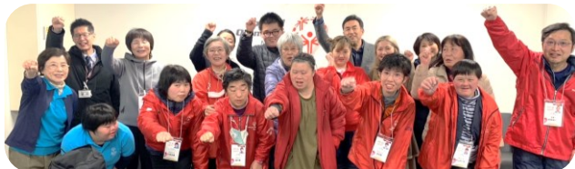
出発式：阿蘇くまもと空港 頑張るぞー!!