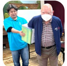
抽選会もありました

お楽しみ会では、アスリートが歌を披露 あまりの上手さにコーチもビックリ!! 最後はみんなで踊って歌って大盛り上がりでした