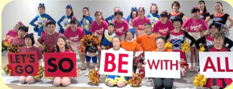
栃木、埼玉、鹿児島、山口、東京、熊本のSOチーム

東京有明コロシアムにて開催されたJO (2024 ジャパンオープンチアリーディング選手権大会) GF (Performance Cheer Grand Final) に、SOチームとして栃木、埼玉、鹿児島、山口、東京の仲間と共に3名のアスリートと2名のパートナーで参加しました。両日ともSOを紹介くださる時間がありGFではSONから平岡拓晃理事長と小塚崇彦ドリームサポーターも参加され新しく始まるポッドキャスト配信のお知らせがありました。延51名のLET'S GO SO BE WITH ALLのコールとパフォーマンスが会場いっばいに元気を届けました。