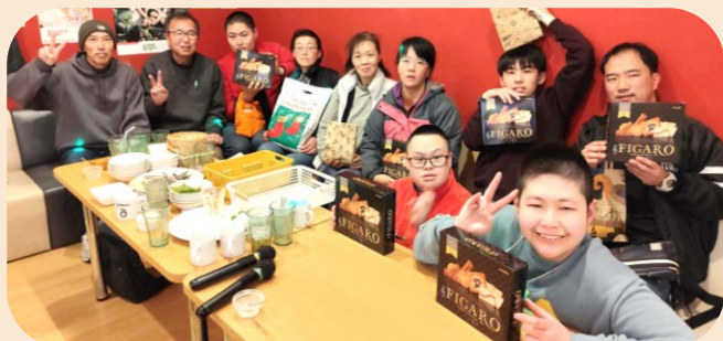
楽しいプレゼント交換中

昨年12月22日(日)に水俣ブランチではクリスマス会を実施しました。今回は、アスリートからの要望が多かったので水俣市内のカラオケ店で、お昼の時間に部屋を3時間貸切って軽食を食べながら実施。アスリートが好きな歌を歌ったり、歌に合わせて踊ったりしました。プレゼント交換もビンゴゲームで。ほとんど歌いっぱなしで、3時間がアツという間でした。