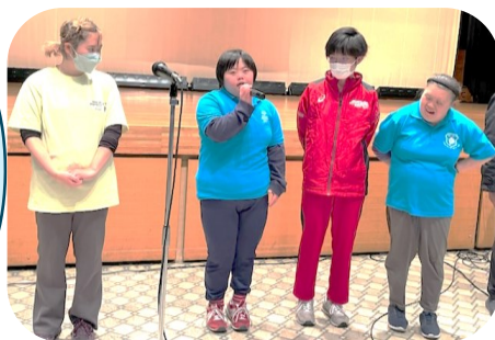
熊本 ブラン チ