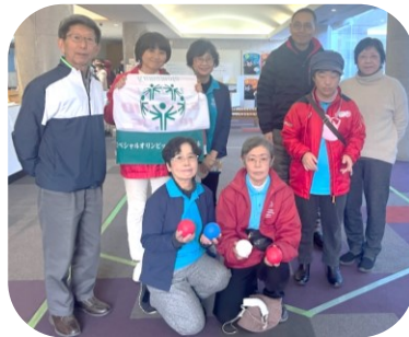
ボランティアとスタッフ

昨年秋、九州・沖縄ブロック大会を開催したご縁で、益城町人権フェスタにポツチャ体験会として参加。小学生、家族連れ、高齢者等多くの皆さんに楽しんでいただきました。近くの高齢者施設の方々はチームを作り、声を掛け合の競技。