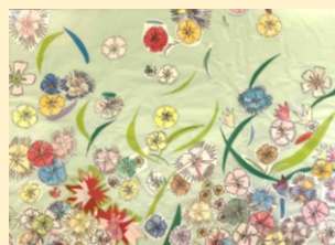
なでしこのコラージュ 済生会 ほほえみ