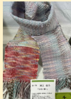
はる (春) 浦上 佳乃