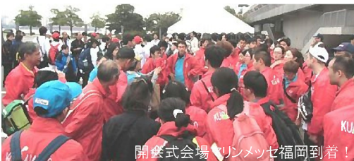
開会式会場、リンメッセ福岡到着!

12年前、初めて参加した東京大会の時の息子は18歳、養護学校を卒業してボウリング競技を始めたばかりの時期で夢中で投げていました。その後も SO ボウリングプログラムに参加し、競技の楽しさや難しさを感じながら、ずっと練習を積み重ねて迎えた今回の大会は「継続は力なり」の言葉通りでした。