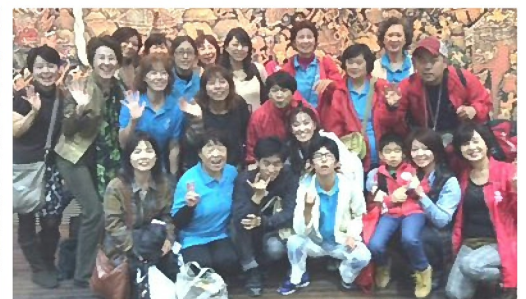
応援団も楽しみました!

ナショナルゲーム福岡の詳細な様子は、2015年1.2月号に掲載予定です。お楽しみに!!