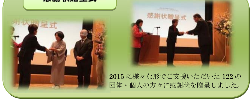
2015に様々な形でご支援いただいた122の団体・個人の方々に感謝状を贈呈しました。