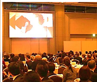
25年の歩みをDVDで振り返り