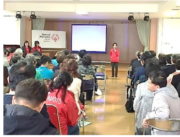
通常総会 議案審議