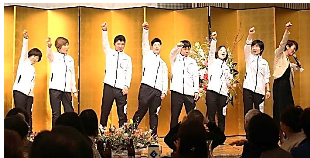
皆さんの応援を受け、がんばるぞ！コール！！