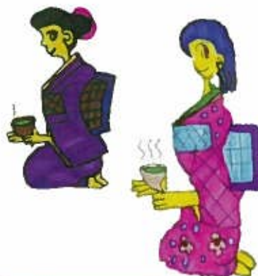
絵・SOアスリート 林 郁子