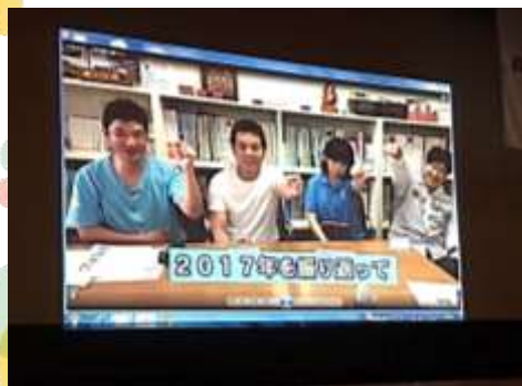
映像で振り返って!