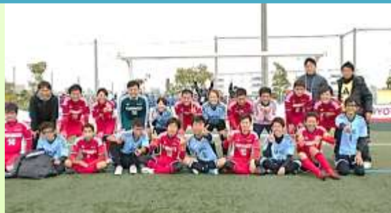
決勝戦を戦った「三重 NASPA ブルー」の皆さんと