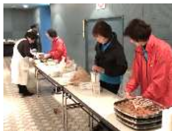
手作りのお料理、おいしかった!