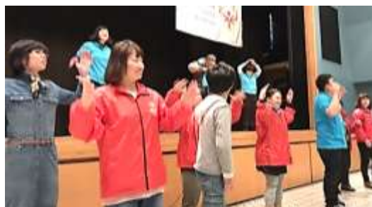
皆で美味しい食事を沢山頂いて、くまモン体操で盛り上がりました。